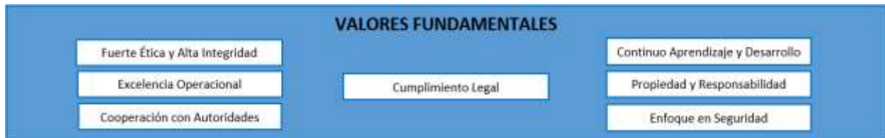
Figura 2 – Valores Fundamentales

Los Valores Fundamentales son los valores que sustentan las metas y creencias de todos los que trabajan en la Profesión de comercio exterior y aduanas No tienen un nivel de competencia y/o habilidad asociado ya que cada individuo debe esforzarse por lograr y demostrar estos valores en todo momento, y se consideran fundamentales para el acercamiento a su profesión.