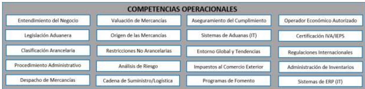
Figura 5 – Competencias Operacionales

Como estas competencias son específicas para las empresas de la industria manufacturera de exportación y los profesionales de comercio exterior y aduanas involucrados en la gestión en las aduanas, se desarrolló una descripción del alcance por competencia que está incluida en el Diccionario de Competencias.